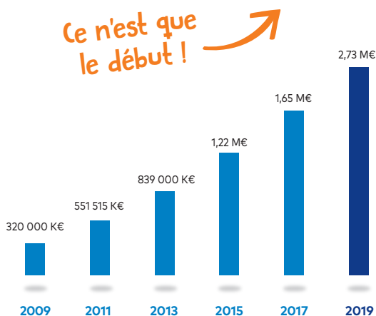
ÉVOLUTION DU CHIFFRE D'AFFAIRES (EN EUROS)