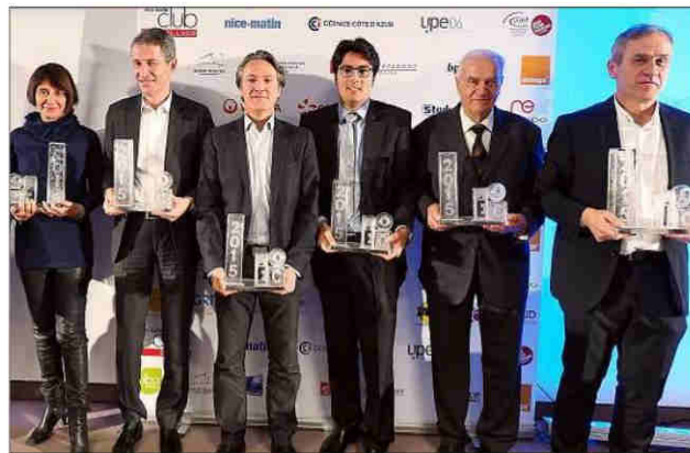
Qui succédera aux lauréats 2015 récompensés en décembre dernier ?

Cette année, six prix seront remis. Six prix décernés selon des critères totalement subjectifs. On assume complètement. Non pas que les critères objectifs de chiffres d'affaires et de solidités des effectifs n'aient été validés. Les entreprises récompensées sont toutes saines et performantes. Mais les Trophées du Club de l'Eco de Nice-Matin vont au-delà des chiffres, ils s'autorisent un supplément d'âme,