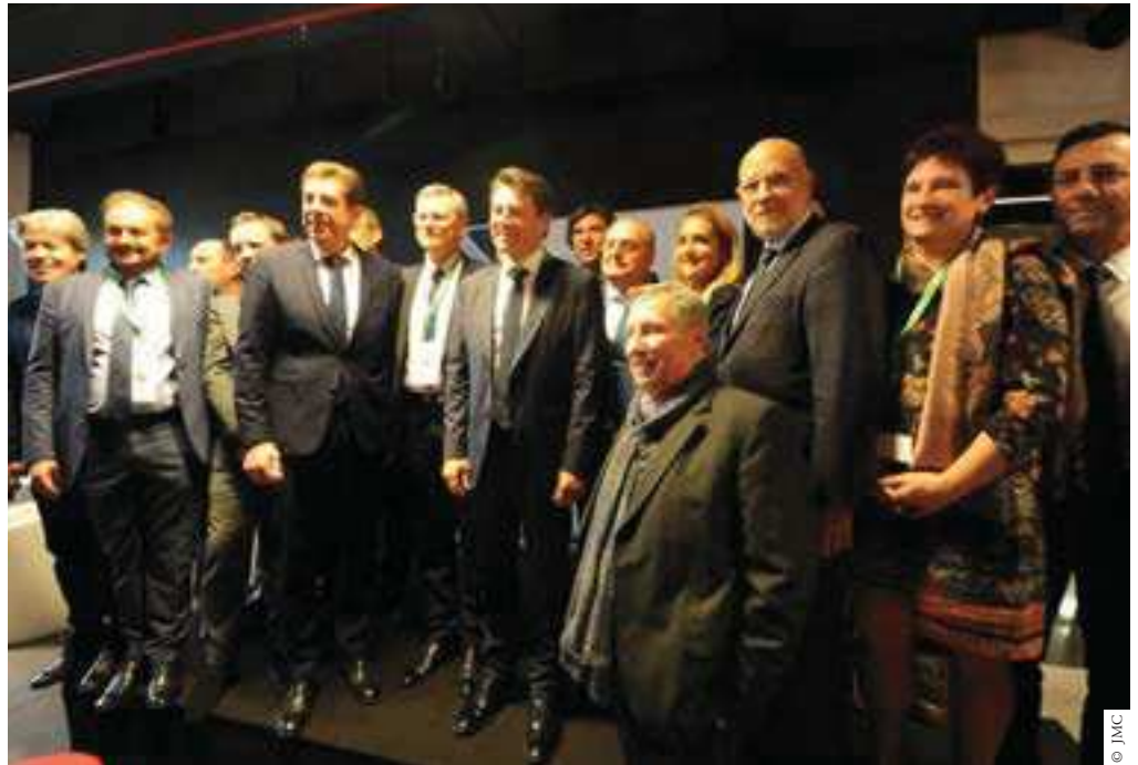
La journée démarre après l'inauguration officielle ! Au programme conférences, ateliers et networking !

Un secteur en pleine transformation, avec la multiplication sur le territoire des très grandes surfaces (agrandissement de Cap 3000, installation de Polygone Riviera, éclosion d'Open Sky à Valbonne, arrivée d'Ikéo près de Nice Valley, agrandissement d'hypermarchés). Les acteurs de terrain disent "stop", le seuil de saturation étant largement atteint, voire dépassé. Le e-commerce, qui a grignoté une part significative du marché sur certains secteurs (8% du chiffre d'affaires global en France), est aussi une opportunité de développement pour les boutiques "physiques", invitées à devenir "phygital", c'est à dire présentes aussi sur le Net. C'est la grande tendance du moment. "Nous souhaitons un commerce conquérant. Il se réinvente en permanence et offre de nouvelles